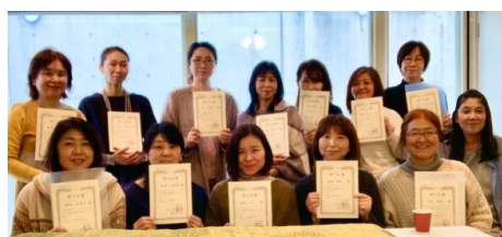
学習法講座修了回