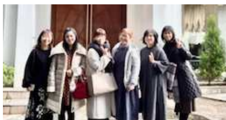
バスティン研究会新年会 in 福岡新年会