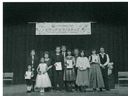
(写真) 過去の博多南地区より

《後援》 文部科学省、福岡市、(株)ヤマハミュージックリテイリング福岡店、 ミュージックギャラリー福岡、(有)ユーオン芸育社 《協力》 ピティナ福岡支部