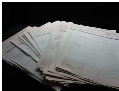
たくさんレポート…♡嬉(^o^)